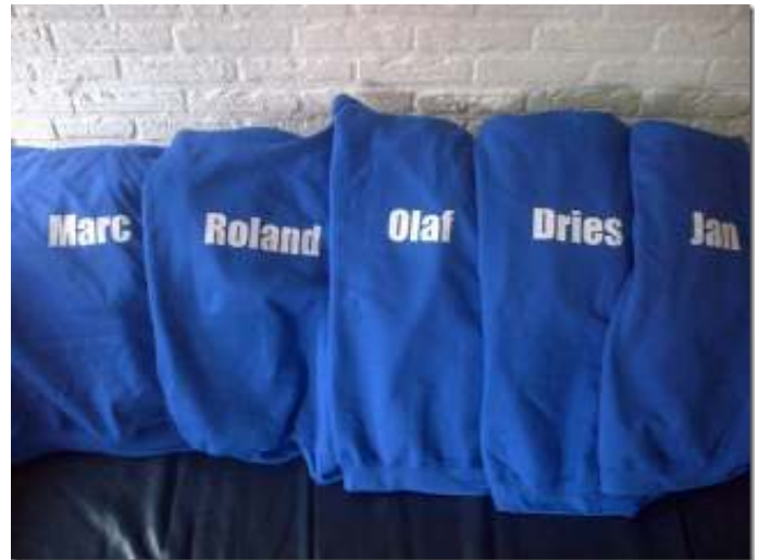
Blauwe TC Westerbork sweaters

Let op: na beëindiging van het lidmaatschap, de sleutel van het tennispark inleveren bij Stien Gilhuis, Oldekamp 15, 9431 HX Westerbork